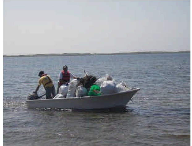
Transport en chaloupe des déchets vers un dépôt temporaire.