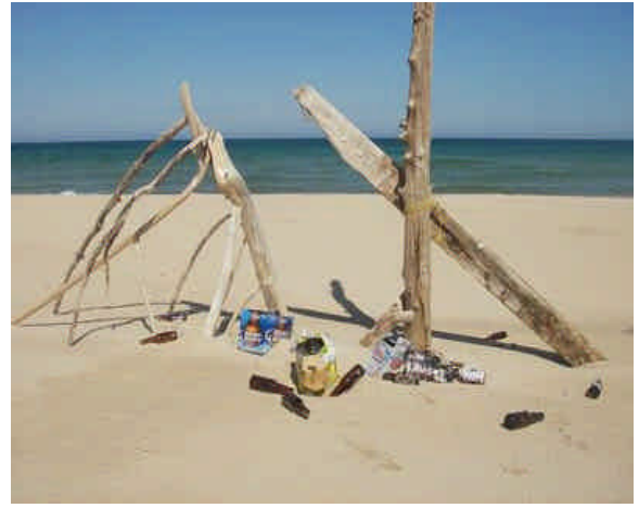
Exemple de déchets sur la plage.