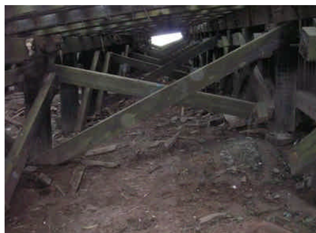
Nettoyage du dessous de la rampe de débarquement à l'Île d'Entrée (après).