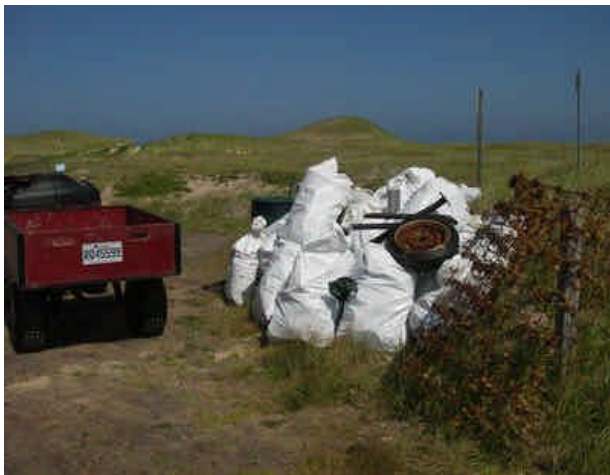
Exemple d'un site de dépôt temporaire près d'un stationnement publique..