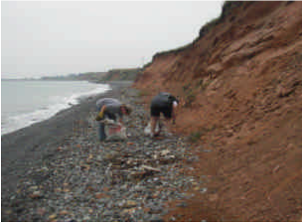
Nettoyage de la berge (Ile d'Entrée).