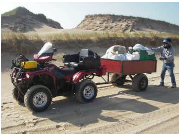
Transport des déchets en VTT vers un dépôt temporaire.