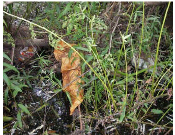
Exemple de déchets dans un ruisseau en milieu boisé.