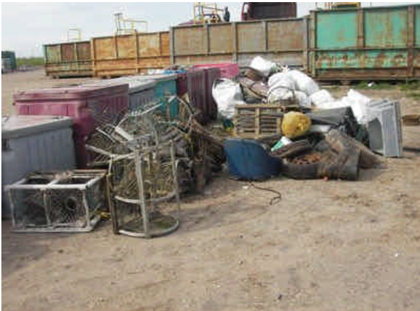
Dépôt au CGMR avant le tri.