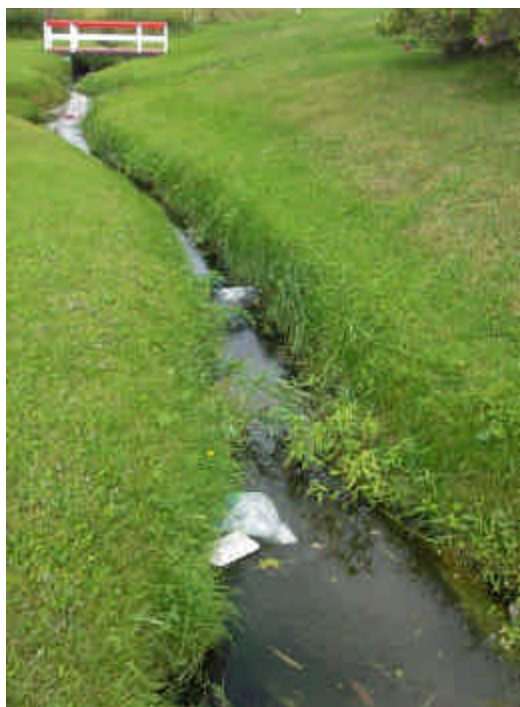
Ruisseau avant nettoyage.