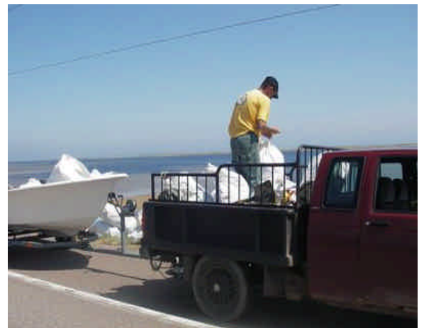
Transport de déchets en camion et chaloupe ver le CGMR..