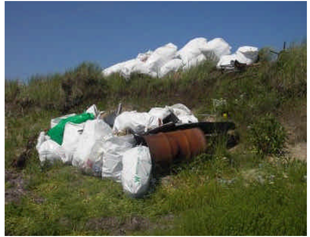
Exemple d'un site de dépôt temporaire près de la route 199.