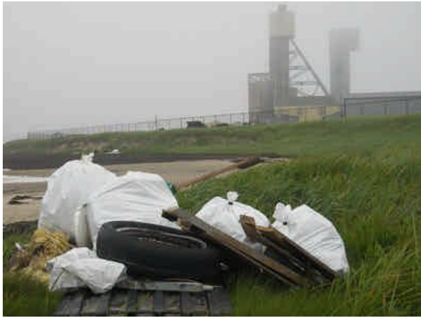
Exemple d'un site de dépôt temporaire en haute berge.