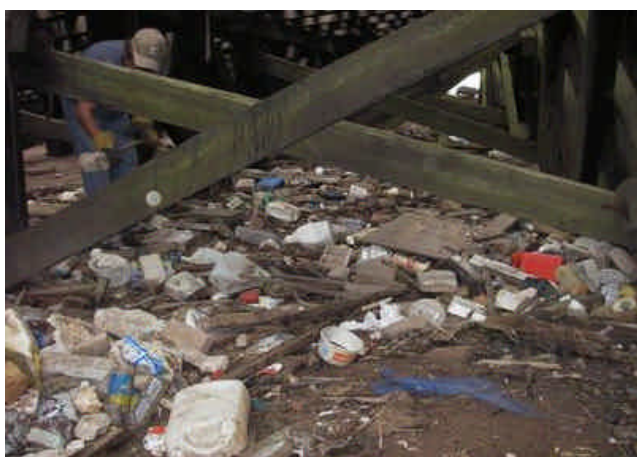
Nettoyage du dessous de la rampe de débarquement à l'Île d'Entrée (avant).