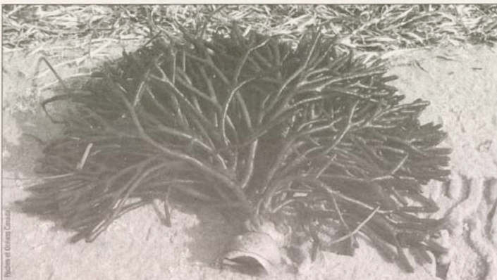
Algue codium fragile