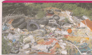
Cédric photo: Comité Zip

En terminant, rappelons que le Comité ZIP est issu du Programme Plan Saint-Laurent, une entente